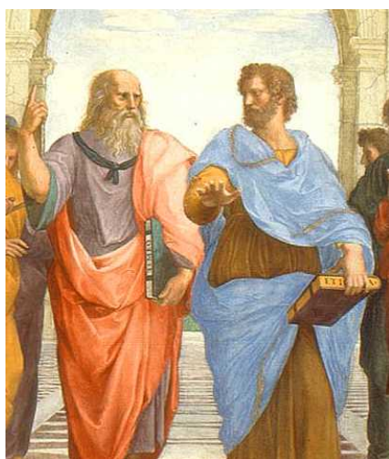
Рафаэль Санти Афинская школа (фрагмент) Рим, Ватиканский дворец, Станца делла Сеньятура 1509 г.

пейзажами Новой Зеландии, фресками Сикстинской капел-