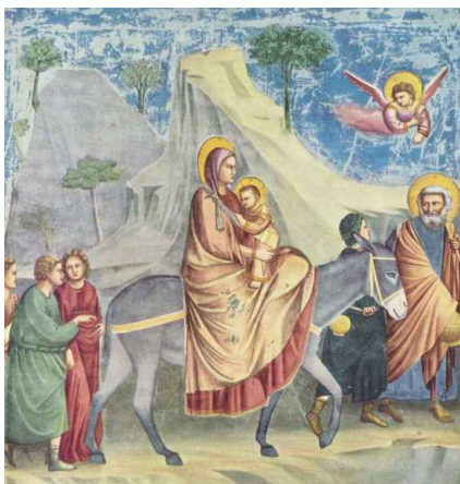
Джотто. Бегство в Египет Падуя, Капелла Скровеньи аль Арена

Как всегда накануне нового учебного года в наших залах произошла смена всех экспозиций. До 20-ых чисел декабря посетители могут в прямом смысле полюбоваться фото-