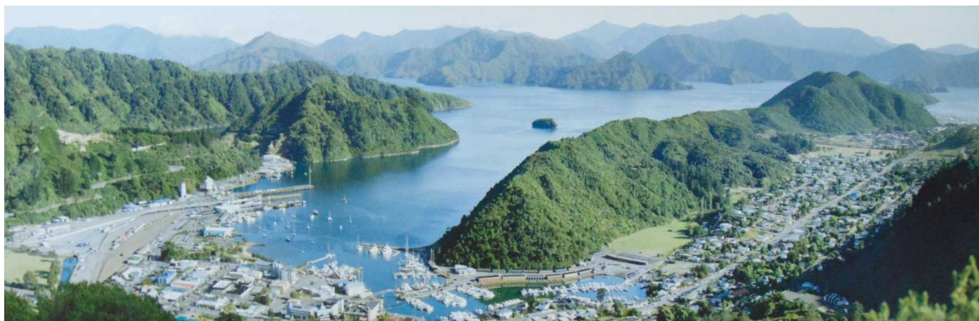
Новая Зеландия. Пиктон