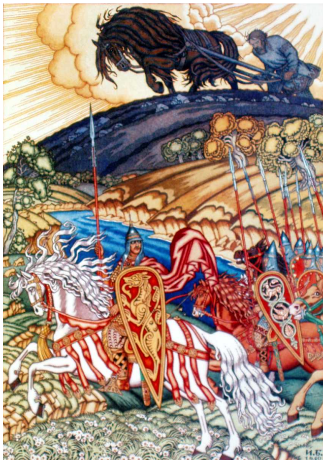
Иллюстрация к былинe «Микула Селянинович»