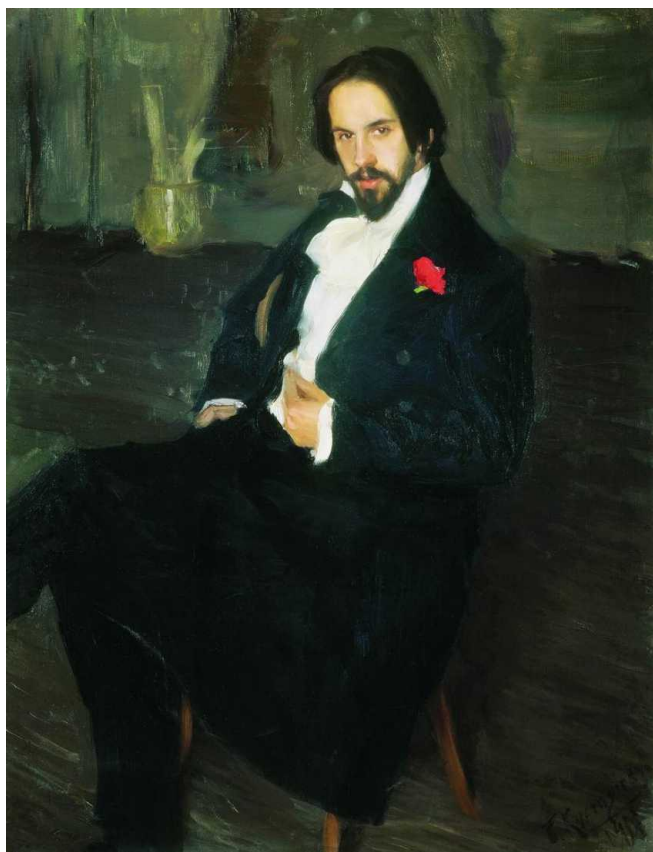
Б.Кустодиев. Портрет И.Билибина