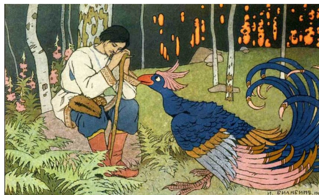
Иллюстрация к сказке «Мария Моревна»