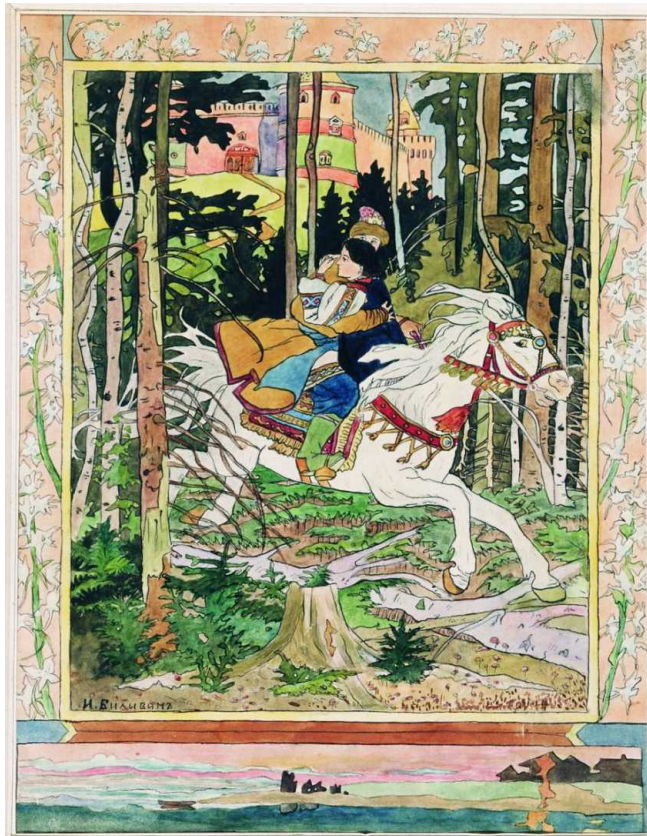
Иллюстрация к сказке «Мария Моревна»

тушь наносил на него контур, а затем раскрашивал рисунок яркими сочными красками колонковой кистью с косо срезанным концом. Со временем стиль Билибина совершенствовался, становился более четким, выраженным. Судьба Ивана Яковлевича сложилась не просто. В сентябре 1917 года он уехал в Крым, где два года прожил на своей даче в приморском поселке Батилимане. А в 1920 году, увлекаемый волной беженцев, уплывает в Египет, где выполняет многочисленные заказы — пишет портреты и панно, изучает искусство Востока, привлекли его и таинственные пирамиды Древнего Египта. В 1925 году Билибин переезжает в Париж. И здесь его судьба складывается вполне благополучно. Блистательные декорации, сделанные им к постановкам русских опер, в которых пел гениальный Шаляпин, восхищают парижан. Художника приглашают оформить балет Стравинского «Жарптица» в Буэнос-Айресе и ряд опер в Брно и Праге. Он иллюстрирует книги русских и французских авторов. Но все же его тянет в Россию. Случай помог ему вернуться на Родину. Билибин знакомится с Советским послом во Франции, который предложил художнику принять участие в оформлении советского посольства в Париже. Иван Яковлевич создал великолепное монументальное панно «Микула Селянинович», что позволило ему в 1936