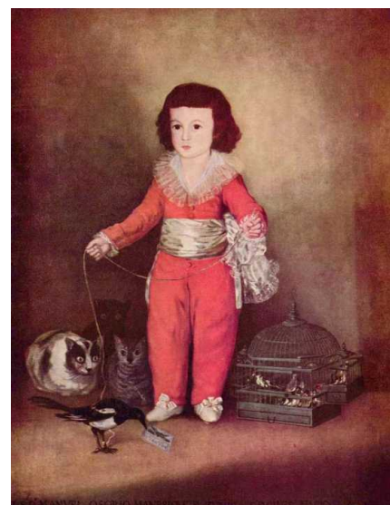
Ф.Гойя. Дон Мануэль 127 * 101,5 см Нью-Йорк, Музей Метрополитен

лы, росписями храмов великого Джотто, книжными иллюстрациями Ивана Билибина, произведениями великого испанского художника Франсиско Гойи и картинами (в качественных репродукциях) русского художника-авангардиста Ивана Годлевского, который мало известен в нашей стране, но популярен во Франции и других странах Западной Европы. Большой вклад в дело популяризации его творчества сделал эксперт по русскому искусству XX века В.С.Каплунов. Именно он познакомил сотрудников «Радуги» с творчеством этого художника и «зажёл» их сердца для создания выставки его работ. На открытии этой