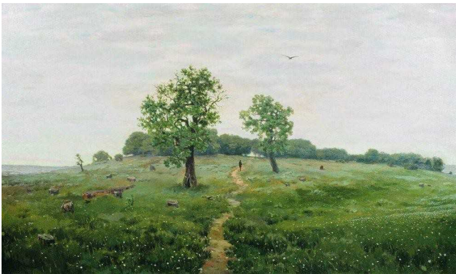
Аполлинарий Михайлович Васнецов Серый день (Серенький денек) [1883] Государственная Третьяковская галерея. Москва