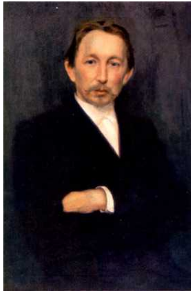
Н. Д. Кузнецов. Портрет Аполлинария Михайловича Васнецова. 1897. Холст, масло. 84*69,5. Государственная Третьяковская галерея. Москва

Аполлинарий Васнецов был скромным и спокойным человеком. Большая культура и эрудиция сочетались в нём со