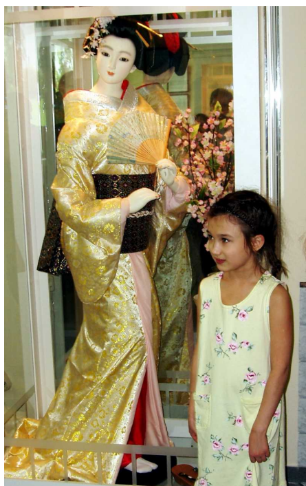
В японском зале