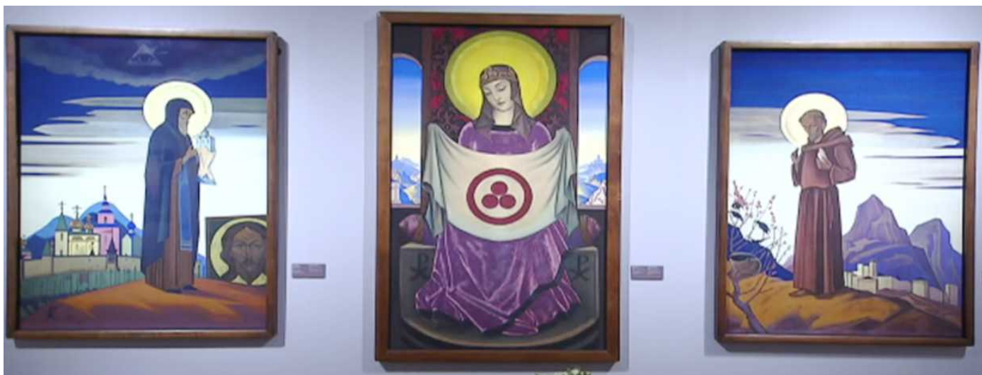
Николай Рерих. Святой Сергий Радонежский. Мадонна Орифламма. Святой Франциск. 1932