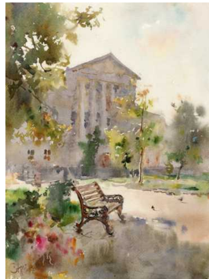
В сквере возле Дома Озерова Бумага, акварель, 31*23 см