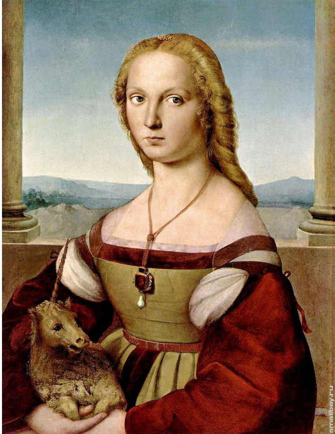
Рафаэль Санти (1483-1520) Дама с единорогом

«Как бы не ссорились, как бы не озверели люди,- говорил художник Н. Рерих,- они все же ОБЪЕДИНЕННО замолкают при звуках мощной симфонии и прекращают препирательства в музее...».