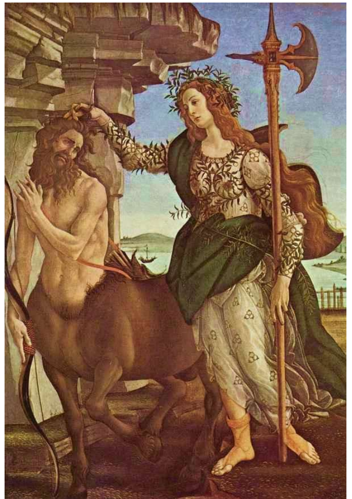
Сандро Боттичелли (1554-1510) Афина Паллада и Кентавр. 4-я четверть XV в.

Это произведение редко покидает пределы Италии. Однако две страны сумели договориться, и шедевр в специальном герметичном контейнере с нужной температурой был доставлен в Москву с