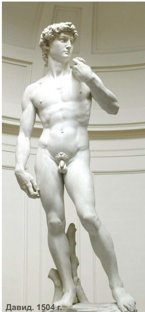
Давид. 1504 г.