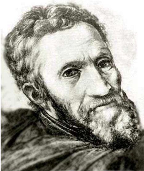
Микеланджело. Фрагмент фрески Дж.Вазари во дворце Кангеллерло. Рим. Середина XVI в

На склоне лет великий Микеланджело Буонаротти, создатель величественных скульптур, бессмертных фресок и глубоко философской поэзии признался, что «он только начал читать по слогам в своей профессии». Потрясающая к себе требовательность!