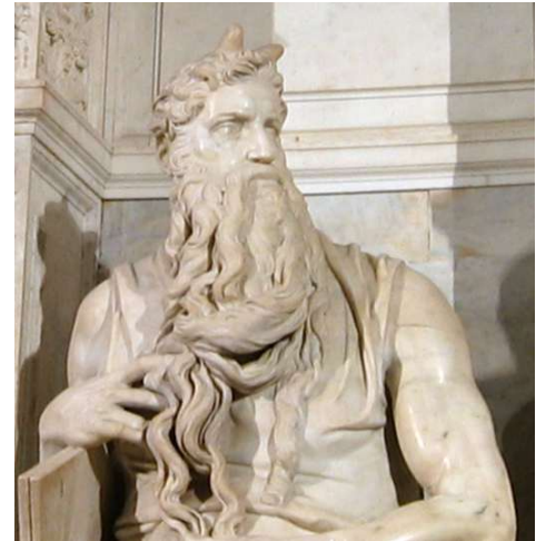
Моисей. 1516 г.

от камня и извлекать образ за образом. Одним из таких образов был и пророк Моисей, скульптуру которого Микеланджело создавал для надгробия Юлия II. Моисей предстаёт перед зрителем как титаническая личность, наделённая могучим темпераментом и столь же могучей волей.