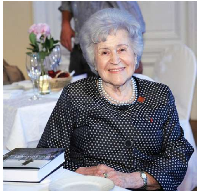
Ирина Антонова, директор ГМИИ им. Пушкина с 1961 года. Настоящий подвижник в деле пропаганды высокого искусства. В 2012 году отметит своё девяностолетие

Главное - не стоять в полной тьме перед произведением искусства, ибо как тьма, так и свет - в нас. И пусть нам не кажется безобидным, если мы позволяем себе смотреть фильмы ужасов, мыльные оперы, передачи, способствующие пропаганде насилия, а, значит, и разъединению. Ибо есть силы, живущие под лозунгом: «Разделяй и властвуй». Не будем вкладывать свою энергию в несовершенство, а окрасим ее прекрасными чувствами, наполненными радостью и любовью.