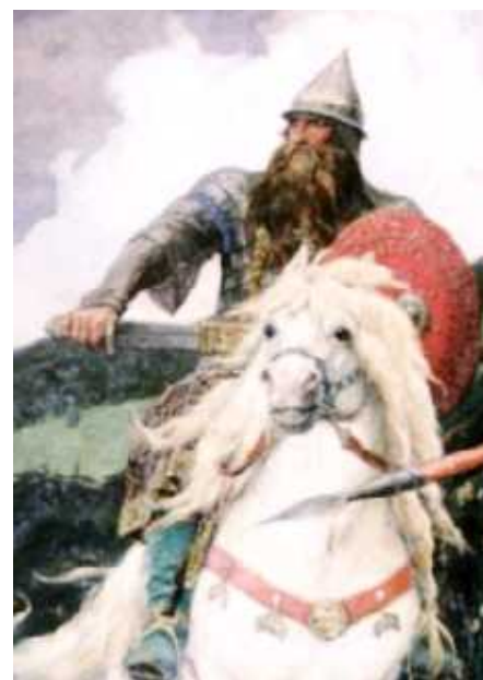
В.Васнецов. Богатыри. Фрагмент

А вот по версии некоторых современных «деятели от науки»... наши предки якобы были настолько отсталыми дикарями, что жили на болотах, пугая всех своим видом, и доблестных подвигов, и достойного оружия де в борьбе с врагами у них не было. Объективное изучение древнерусского оружия опровергает эту примитивную точку зрения и показывает высокий уровень развития Древней Руси еще в 1 тысячелетии до нашей эры.