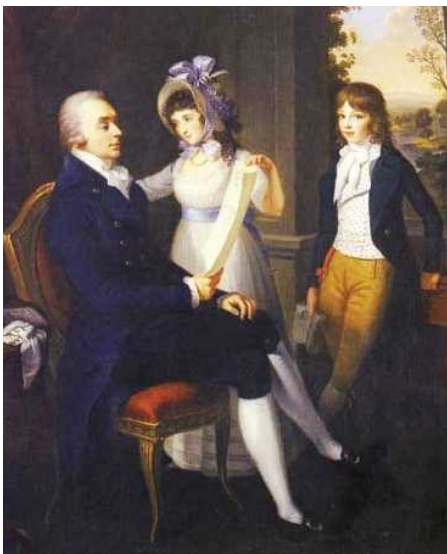
Семён Романович Воронцов с детьми

Семён Воронцов до начала своей дипломатической карьеры подавал большие надежды на военном поприще, считая службу в русской армии своим предназначением. Не случайно он был удостоен высокой оценки А.Суворова: «Тактика ваша