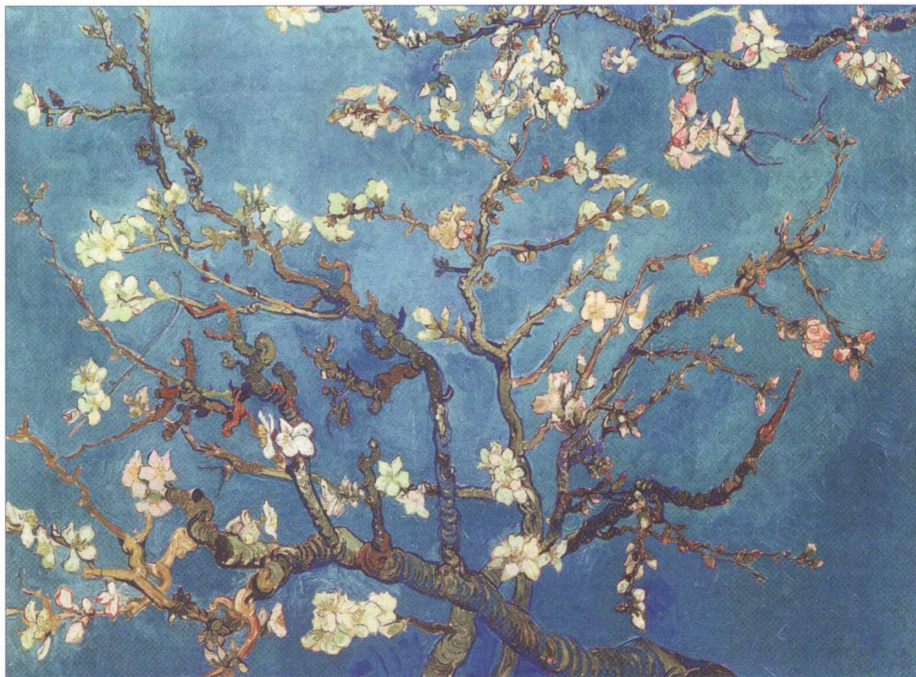
Ван Гог. Ветви миндального дерева в цвету

Человеческий организм - тонкая система, постоянно улавливающая энергию из окружающей среды и в том числе - от произведений искусства. Когда мы смотрим на произведения живописи, в головном мозге проходит целый ряд идей, мыслей, образов и фантазий. Воспринимаемые нами цвета испускают, в соответствии со своей