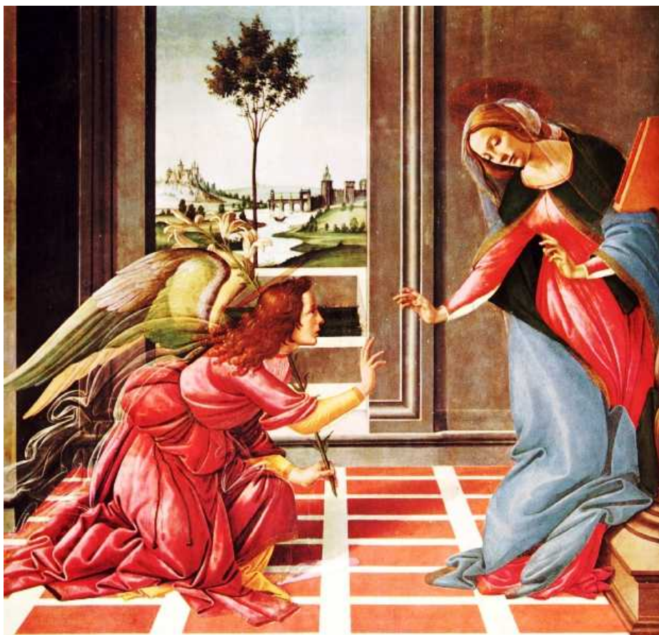
Сандро Боттичелли. Благовещение. 1490 г.

Из газеты «Вестник неврологии и психиатрии». «Нейрон». №8