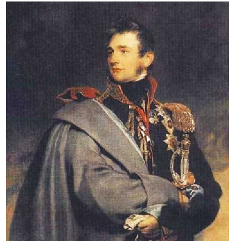
Михаил Семёнович Воронцов

ность Михаила Семеновича Воронцова. В двухлетнем возрасте он потерял мать. До совершеннолетия проживал в Англии с отцом, который там находился на госслужбе (дипломат, посол). Крестной матерью Михаила была Императрица Екатерина Великая.