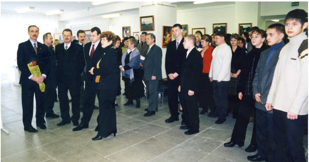
Культурно-выставочный центр «Радуга» в дни осуществления проекта «Культурная столица Поволжья», 2004г.