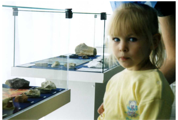
В гостях у хозяйки горы

В нашей коллекции есть белый нефрит из Бурятии.