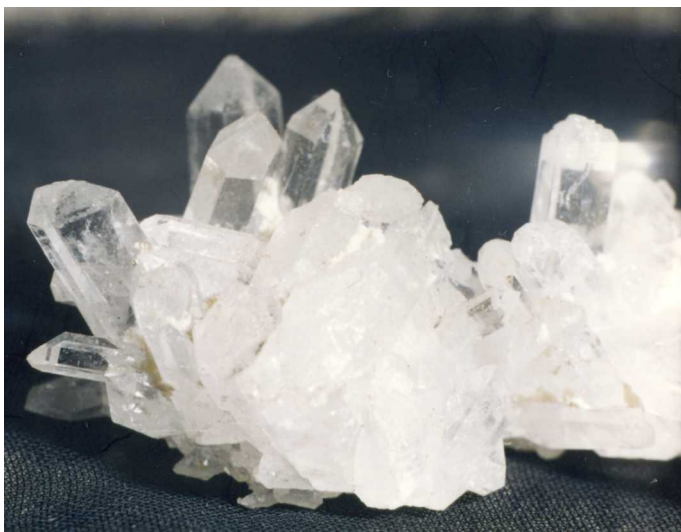
Друза горного хрусталя