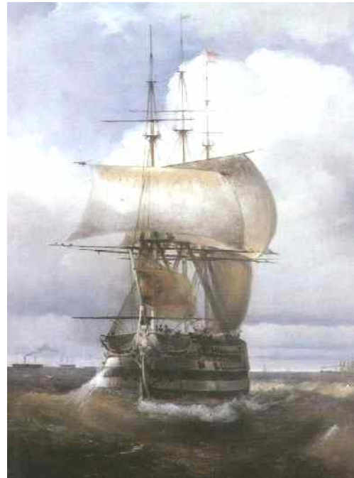
И.К.Айвазовский. Большой рейд в Кронштадте (Фрагмент), 1836г.

КВЦ «Радуга» приглашает посетить выставку