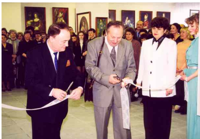
Открытие «Радуги» 25 марта 2000 года