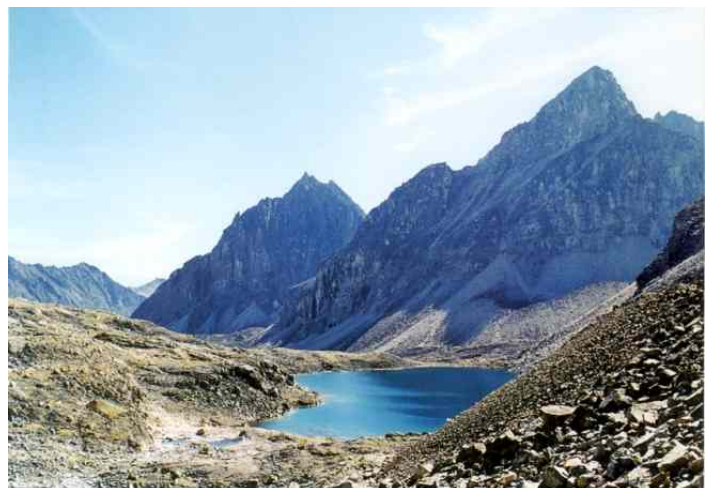
Чарующий край Забайкалья. Кодар

Здесь так много и ручьев, и рек, и озер! Особую жизнь мы видим в водной стихии. Вспыхивают бриллиантовыми искорками росинки, отражая в себе отторгнутый нами мир, капельки весело сливаются, появляется шаловливая струйка, которая тут же находит вторую, третью.... А вот они, переплетаясь уже в едином потоке ручья, спешат к реке. Камни, упавшие со склонов, упрямы: они не хотят уступать путь реке. Но для воды и здесь забава веером расходятся струи, и капельки, взметнувшись ввысь, на мгновение снова обретают самостоятельность для нового и полного слияния сначала с рекой, а потом и с морем. Нет жизни без воды главного чуда планеты.