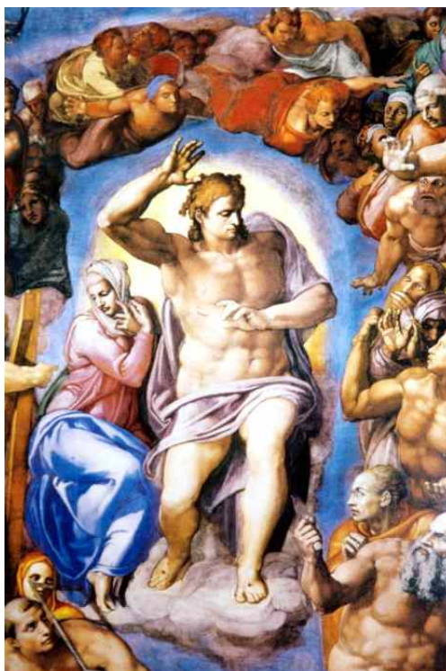
Микеланджело. Страшный суд. Ватикан