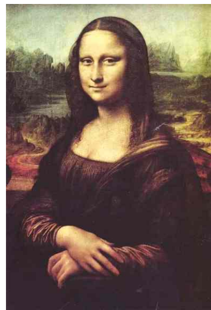
Леонардо да Винчи. Джоконда. Париж, Лувр