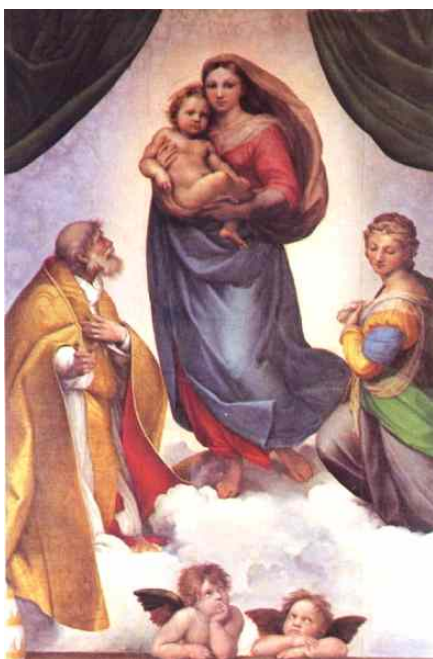
Рафаэль. Сикстинская мадонна. Дрезден