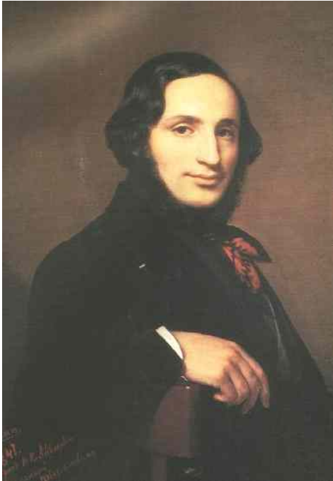
А.В.Тыранов. Портрет И.К.Айвазовского. 1841г.