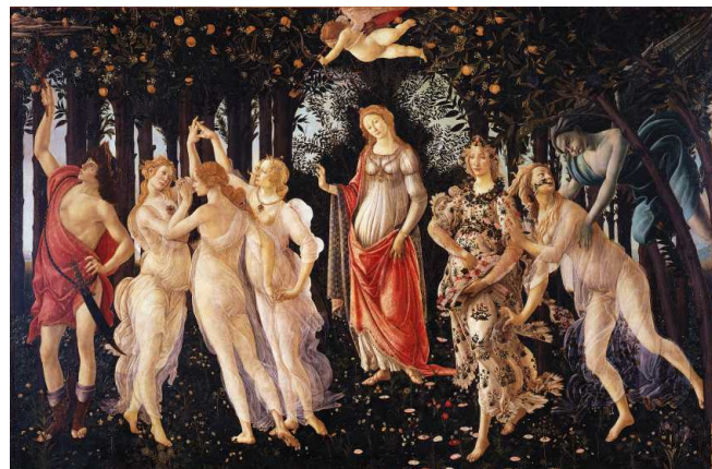
Сандро Боттичелли Весна. Около 1478 г. Дерево, 203*314 см Италия, Флоренция, Галерея Уффици

«Любите и помогайте другим любить! Несите радость духа окружающим Вас!!!».