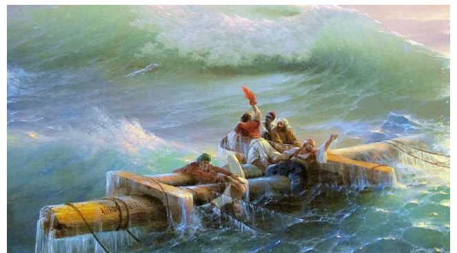
И.К.Айвазовский Девятый вал (фрагмент). 1850 г. Холст, масло. 221*332 см. Государственный Русский музей, Санкт-Петербург

Похоронен Айвазовский на территории армянской церкви, которую расписывал и где был крещен. На надгробии высечены слова древнеармянского историка Мовсеса Хоренаци: «Рожденный смертным, оставил по себе бессмертную память».