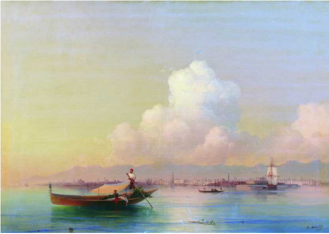
И.К.Айвазовский Вид Венеции со стороны Лидо. 1855 г. Масло, холст.

Харьковский художественный музей, Украина