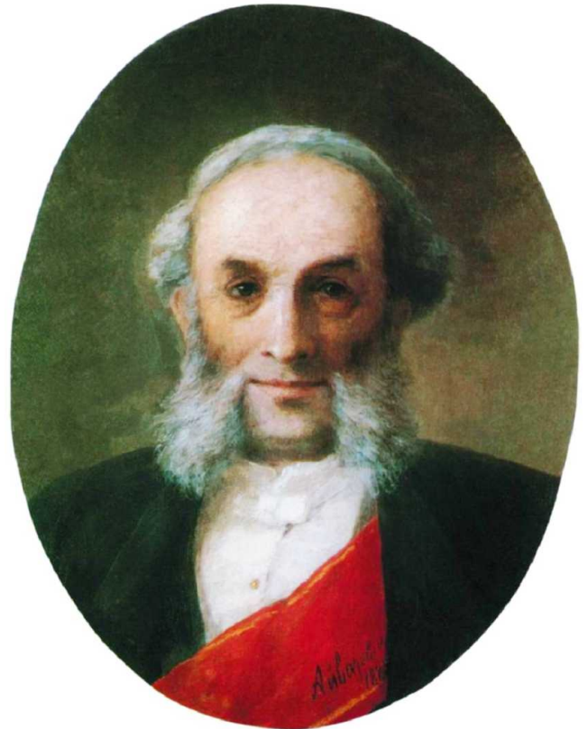
Авторпортрет И.К.Айвазовского. 1881 г. 61*48 см.