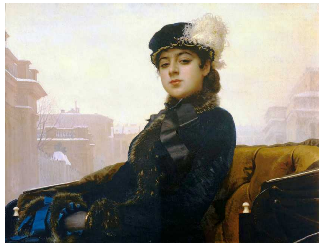
И.Н.Крамской Неизвестная. 1883 г.

Но особенно популярной стала картина после появления в 1907 году знаменитого блоковского стихотворения, давшего ей второе название «Незнакомка», и строки которого в чем-то перекликаются с «Неизвестной» Крамского. Подобно видению, «всегда без спутников, одна, дыша духами и туманами», она возникает в морозной дымке и быстро проносится мимо изумленных и очарованных петербуржцев, лишь на мгновение остановив на них высокомерный взгляд. Неизвестная, откинувшись на кожаное сиденье экипажа, богато и со вкусом одета: на ней темно-синяя бархатная шубка, отороченная серебристым мехом и убранный атласными лентами. Элегантную прическу почти скрывает изящная шляпка с белым страусовым пером. Одна рука в пушистой муфте, другая, с поблескивающим золотым браслетом, затянута в темную лайковую перчатку. Дама недоступна в своей величавой красоте, но напускное хладнокровие не может скрыть внутренней энергии, страстности, которые