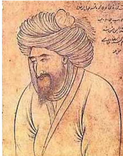
Риза Аббаси Портрет старика. XVII век

поэма состоит из описаний пятидесяти царствований, начиная от царей легендарных и кончая личностями историческими. Один из них – Пророк Зердушт