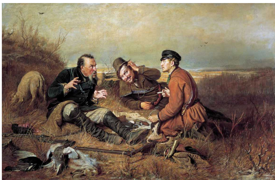
Василий Перов. Охотники на привале. 1871 г.

Эту жанровую сценку можно рассматривать и как глубокое философское произведение. Молодой персонаж символизирует молодость, пору познания мира. Средний – зрелость, пору нажитого опыта, когда многое ставится под сомнение. Пожилой символизирует старость, время обращения к воспоминаниям. Таким образом, жизненный цикл замыкается.