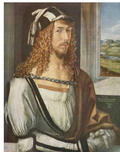
Альбрехт Дюрер Автопортрет. 1498 г 52*41 см, Мадрид, Прадо

сколько работа, проведённая Р.К.Баландиным, автором книги «100 великих оригина-