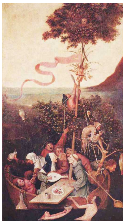
Босх Иероним Корабль дураков. Ок. 1500 Дерево, 56*32 см Париж, Лувр

Возможно, в наши дни подобные дураки рассуждают иначе. Наиболее продвинутые из них отдаляются от книг, обращаясь к всеведущему Интернету. Но если хорошая книга учит размышлять самостоятельно, сомневаясь и вырабатывая цельность мышления, то компьютерные версии (пересказы) представляют разрозненные ответы на те или иные вопросы. Возникает эффект «рваной мысли», пригодной для решателей крос-