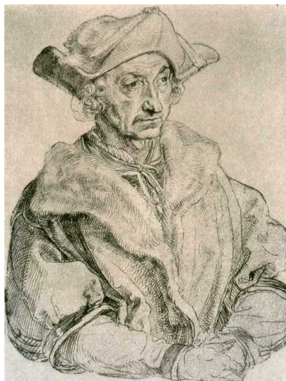
Альбрехт Дюрер Себастьян Брант Около 1520 г.

лов и чудаков», чтобы выяснить насколько изменились люди за прошедшие пятьсот лет.