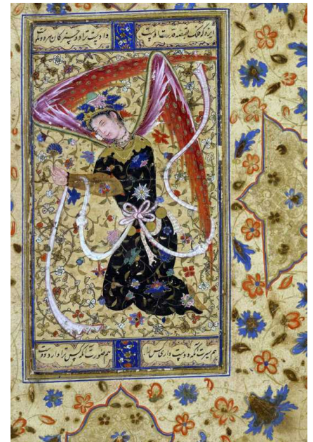
Ангел. Бухара. 1555 г. Лондон, Британский музей

традиции – иранская художница Насрин Батени – признанный мастер миниатюры. В 2013 году две ее работы были включены ЮНЕСКО в список достижений современной культуры Ирана.