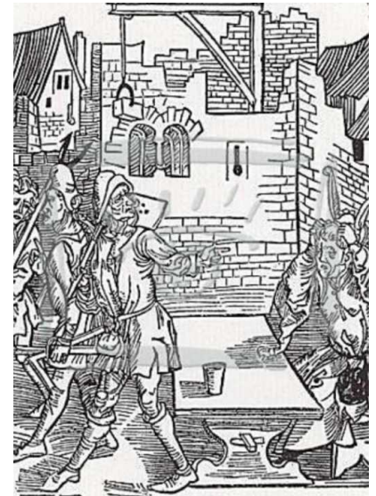
Альбрехт Дюрер Дурак, не рассчитавший свои силы Иллюстрация к книге

Читая стародавнюю сатиру Себастьяна Бранта, поневоле задумываешься о том, что же в конце является целью современного человечества? Разрушение окружающей природы и опoшление личности ради приобретения некоторыми - не из лучших - людьми наибольших материальных благ, капиталов, власти, комфорта? Не превращаемся ли в таком случае мы в