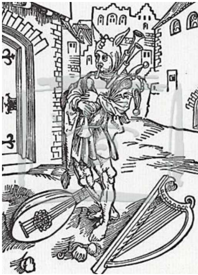
Альбрехт Дюрер Дурак с волынкой Иллюстрация к книге

Конечно, и механическому человеку ничто человеческое не чуждо. Только вот у